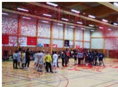
Remise du trophée lors du dernier tournoi des rois.

Bien évidemment l'équipe locale du HBC Nantes sera au rendez-vous. Une équipe de la région parisienne, et du sud de la France seront également de la partie. À l'heure où nous écrivons cet article la quatrième équipe reste en cours de négociation, mais nul doute que le plateau sera complété par un grand nom du hand.